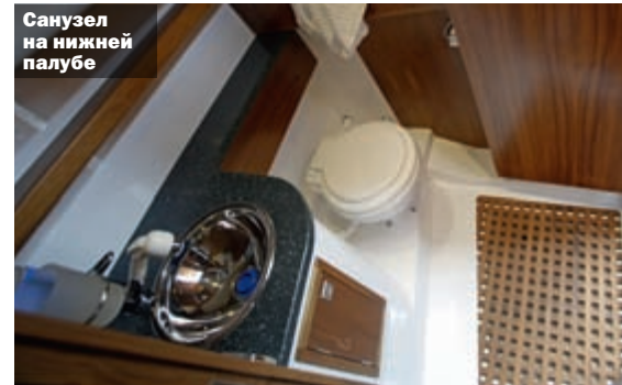
Санузел на нижней палубе

«Внимание к деталям придает лодке безукоризненные эксплуатационные качества и эффектный внешний вид»