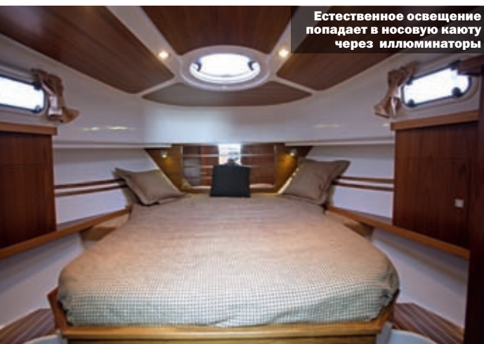
Естественное освещение попадает в носовую каюту через иллюминаторы