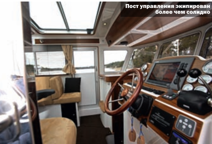
Пост управления экипирован более чем солидно