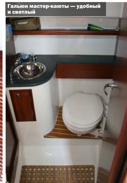
Галлеи мастер-каюты — удобный и светлый