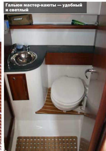
Галюн мастер-каюты — удобный и светлый