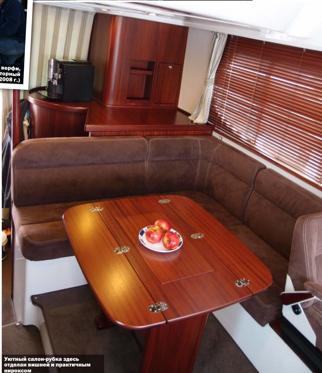
Уютный салон-рубка здесь отделан вишней и практичным нироксом

Высокий фальшборт и прочный релинг обеспечивают безопасность, что особенно важно, когда на борту дети