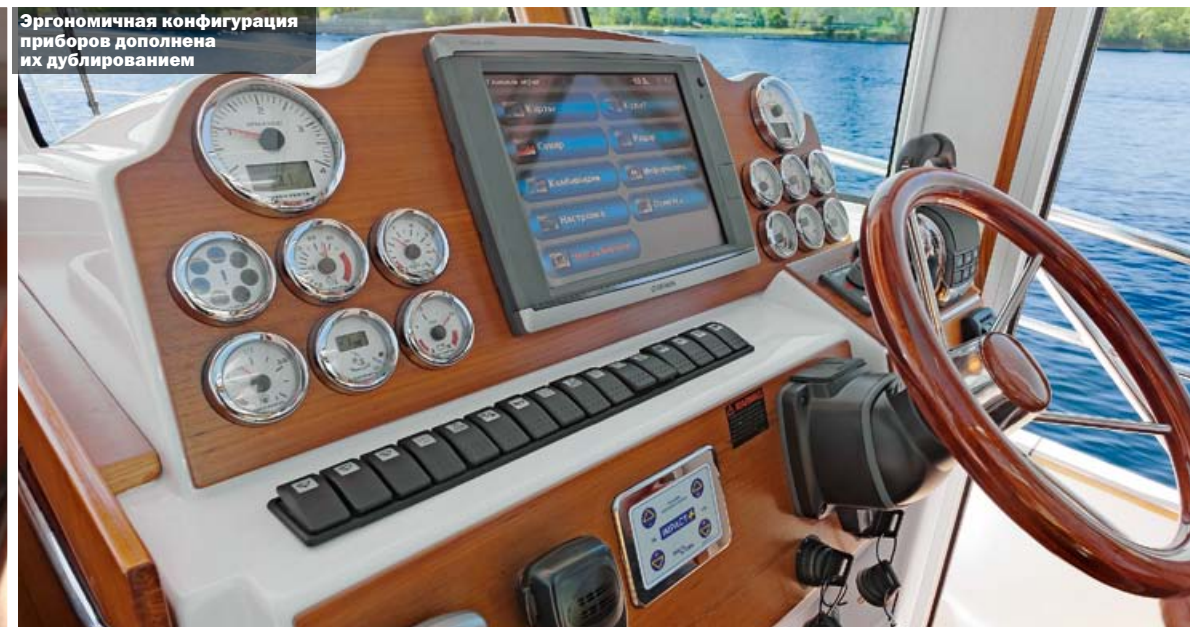
Эргономичная конфигурация приборов дополнена их дублированием