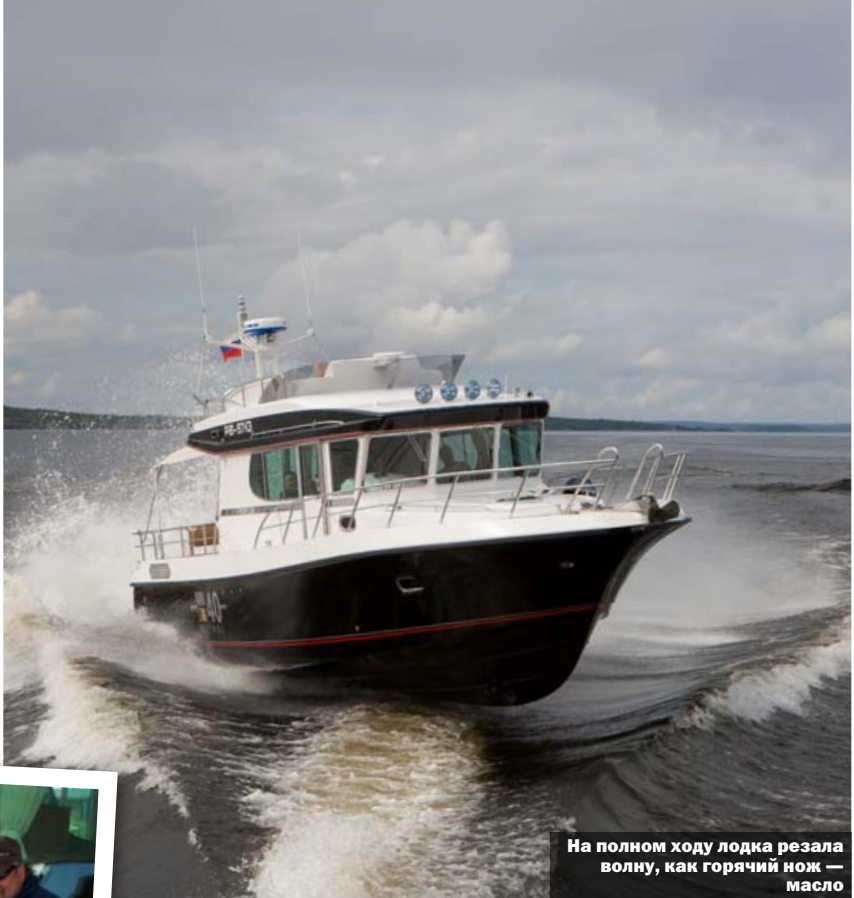
На полном ходу лодка режет волну, как горячий нож — масло